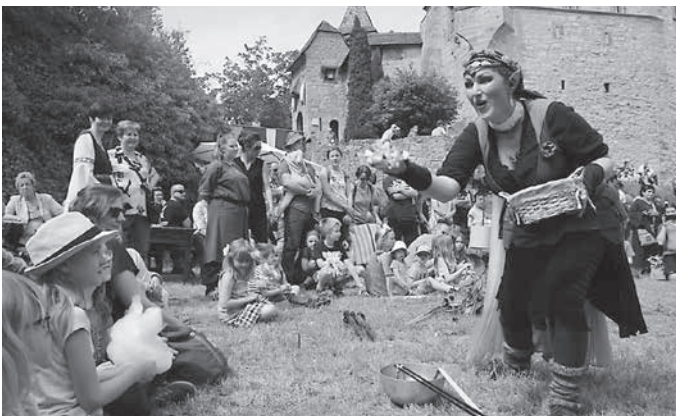
Förderkreis Oberschloß Kranichfeld e. V.

Der Förderkreis Oberschloß Kranichfeld e. V. blickt zurück auf ein berauschendes Jubiläumsburgfest zu Pfingsten mit herrlichem Wetter, vielen Gästen, Musik, Feuertanz, Feuerwerk und Lichtershow. Es war ein ganz besonderes Burgfest. Vielen Dank dafür an alle Mitwirkenden, im Besonderen den Helfern, Händlern, Künstlern und natürlich den zahlreichen Gästen, die unser Burgfest so erfolgreich gemacht haben. Wir danken auch besonders allen, die uns mit Spenden unterstützt haben. Wir hoffen auf viele weitere, vor allem so schöne und gelungene Burgfeste und freuen uns jetzt schon auf die diesjährige Schlossweihnacht am dritten Adventswochenende.