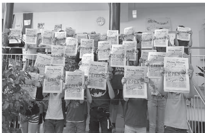
Die SchülerInnen und die Klassenlehrerinnen der Klassen 3 a und 3 b.

Dafür möchten wir uns auf diesem Wege ganz herzlich bedanken.