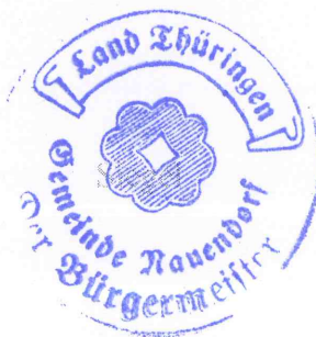
Eckard Brand Bürgermeister

Nauendorf, den 15.10.2014 Gemeinde Nauendorf